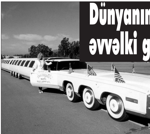
Dünyanın ən iri avtomobili hesab edilən məşhur "American Dream" limuzini ameri-