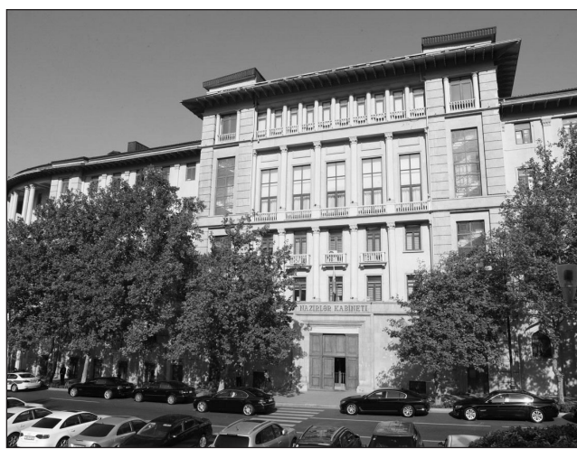
Azərbaycanda 50 yeni koronavirus infeksiyasına yoluxma faktı qeydə alınıb, 39