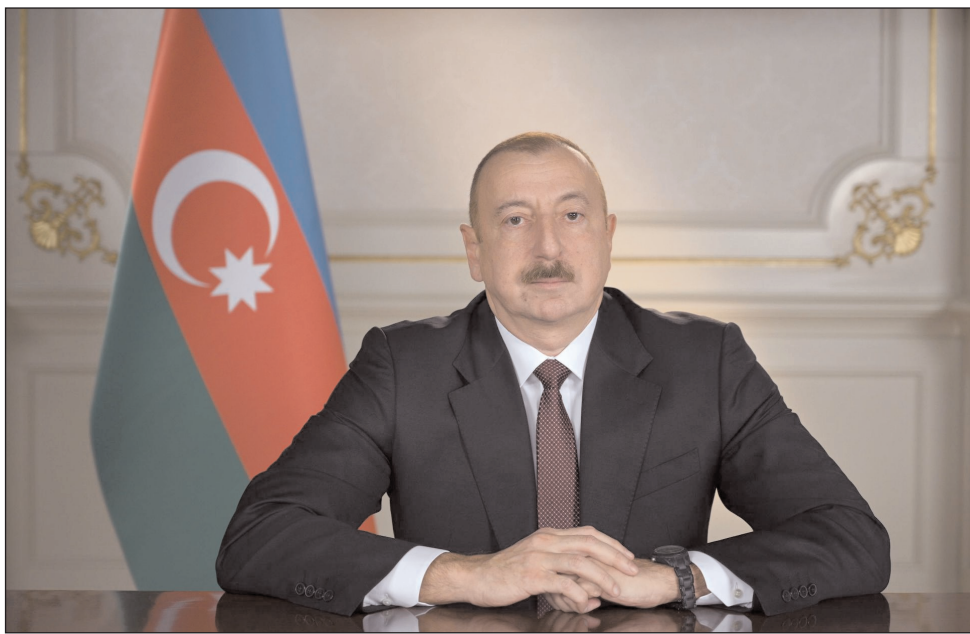
Prezident İlham Əliyev "Koronavirus pandemiyasına qarşı Azər-

baycan Respublikasında həyata keçirilən səhiyyə tədbirləri çərçi-