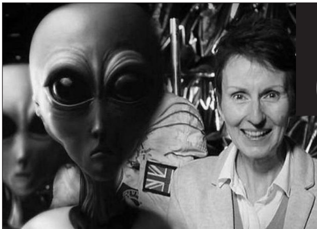
İlk ingilis qadın astro- navtı Dr.Helen Şerman 1991-ci ildə Sovet "Mir" kosmik stansiya-

sında 8 gün keçirib. Qadın yadplanetlilərin aramızda yaşadığını açıq şəkildə iddia edir. "Milli.Az"