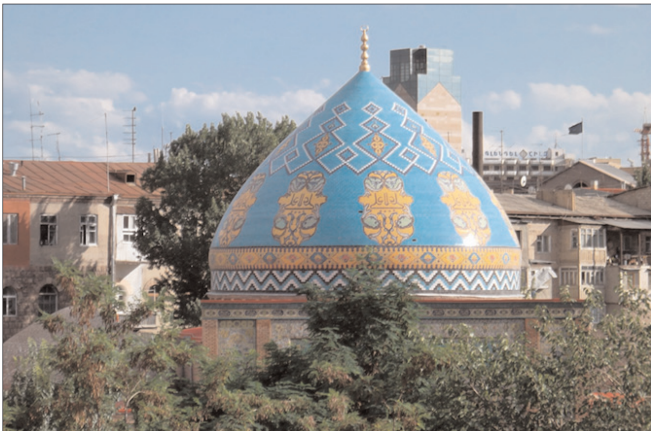
"Paşinyanın göstərişi ilə artıq bu saxtakarlıq işlərinə başlanıb"

İsmayıl Tanrıverdi: "Onlar bu "muzeyi" ona görə yaradırlar ki..."