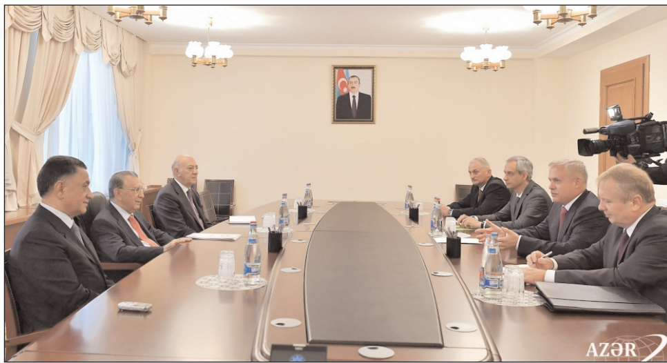
Belarus Azərbaycana yaxın olan bir dövlət kimi çox istər-