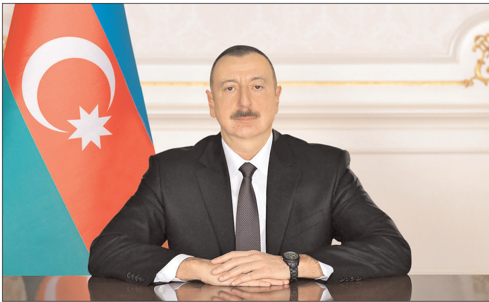
Prezident İlham Əliyev Amerika Birləşmiş Ştatlarının Prezidenti Donald Trampa təbrik məktubu göndərib.

Təbrikdə deyilir: "Hörmətli cənab Prezident, Amerika Birləşmiş Ştatlarının milli bayramı - Müstəqillik Günü münasibətilə Sizə və Sizin simanızda bütün xalqınıza