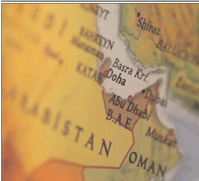
Oman körfəzində Britaniya ordusuna bağlı