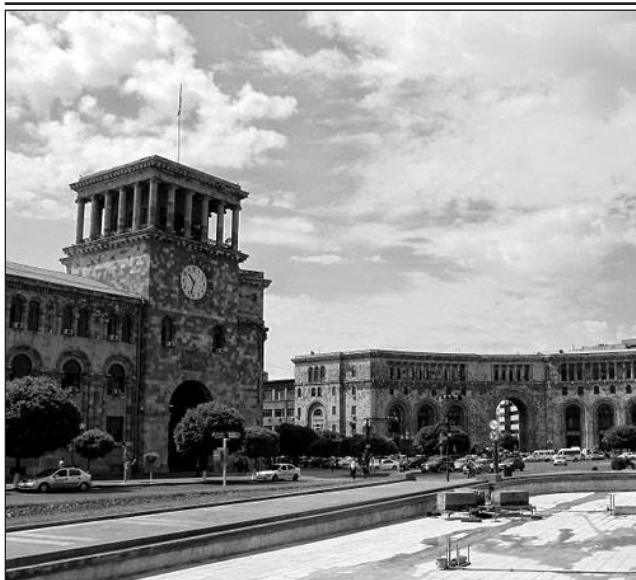
"Xaricdə yaşayan ermənilər tərəfindən ölkəyə göndərilən valyutanın azalması..."

2019 - ilin yanvarında MDB ölkələrində sənaye istehsalı keçən ilin analoji dövrü ilə müqayisədə 1,3% artıb. Bu barədə məlumatı MDB Statistika Komitəsi yayıb.